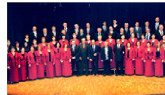
Orfeón San Juan (Alicante)