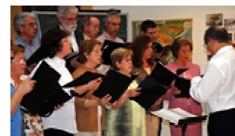
Orfeón Juan del Enzina, de Villacañas (Toledo)