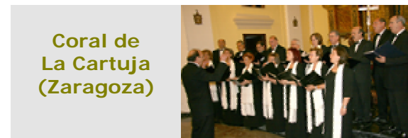
Coral de La Cartuja (Zaragoza)